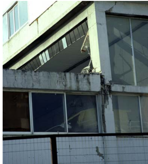
Φωτ. 23 (αρ.): Αστοχία κόμβου και απώλεια περίσφιγξης συνδετήρων λόγω τοποθέτησης υδρορροής εντός του υποστυλώματος Φωτ. 24 (δεξ.): Εμβολισμός υποστυλώματος από την πλάκα γειτονικού χαμηλότερου κτιρίου