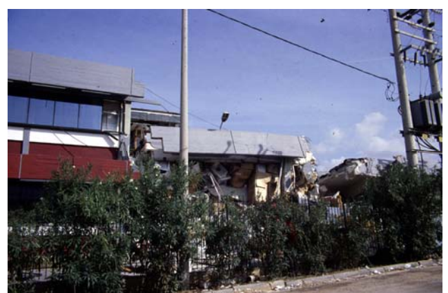
Φωτ. 25 (αρ.): Μικρό άνοιγμα αρμού διαστολής από οριζόντια σεισμική μετακίνηση σε κτίριο μεγάλης κάτοψης Φωτ. 26 (δεξ.): Στο ίδιο κτίριο, απώλεια στήριξης δοκού αρμού διαστολής λόγω μεγάλου ανοίγματος αρμού