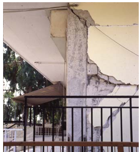
Φωτ. 19 (αρ.): Διατμητική αστοχία τοιχώματος με μεγάλες παραμορφώσεις