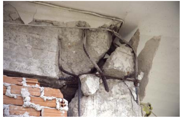
Φωτ. 21 (αρ.): Αστοχία εξωτερικού κόμβου με μείωση ακαμψίας του Φωτ. 22 (δεξ.): Αστοχία εξωτερικού κόμβου και πρακτική απώλεια στήριξης δοκού