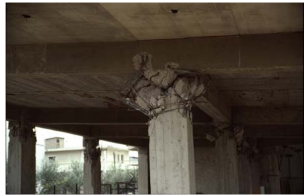
Φωτ. 10,11 (αρ. & δεξ.): Διατμητική αστοχία πάνω άκρου υποστυλωμάτων λόγω απουσίας συνδετήρων. Ο μανδύας συνδετήρων έφτανε μέχρι 0.50 m κάτω από τις δοκούς